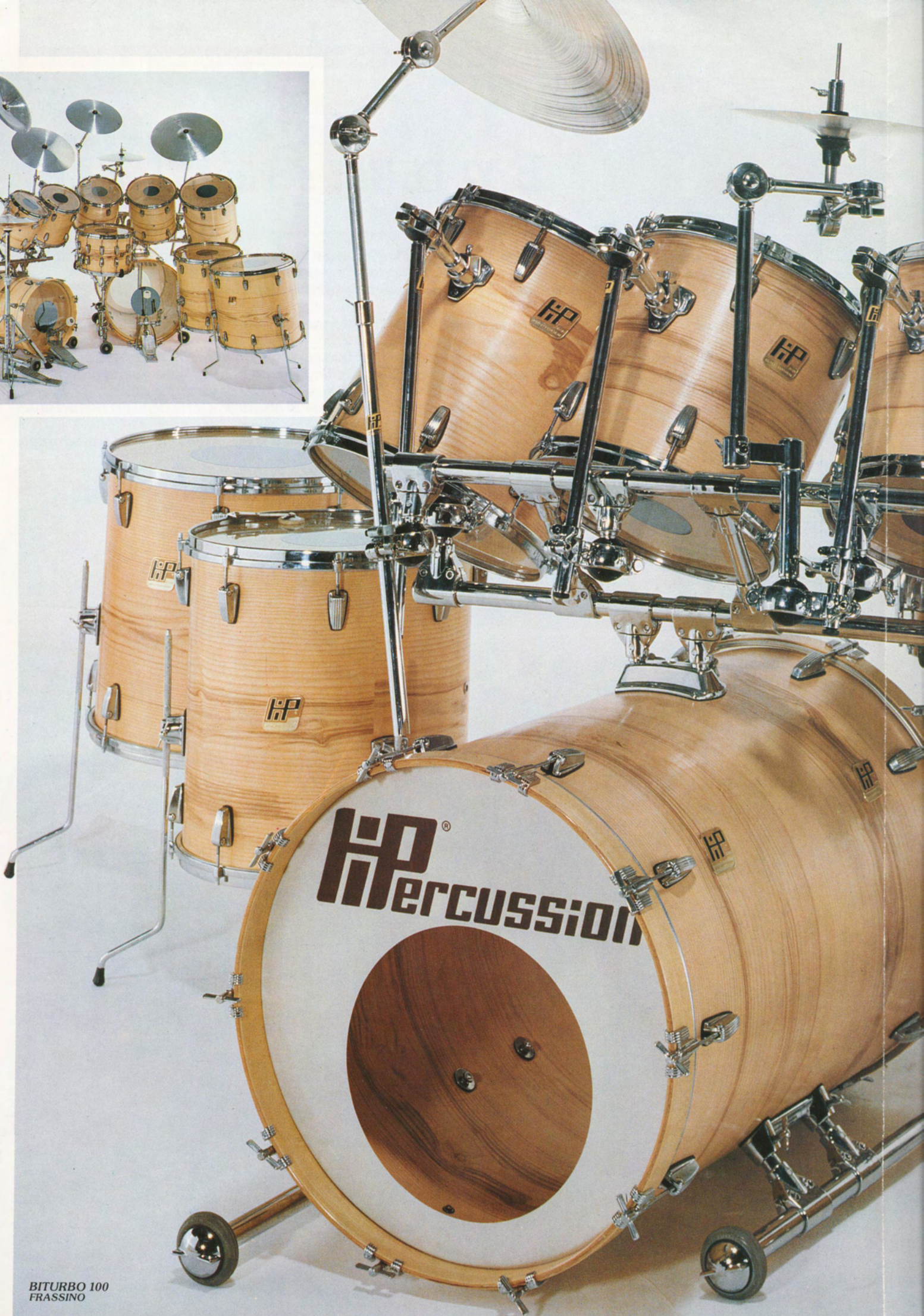
BITURBO 100 FRASSINO