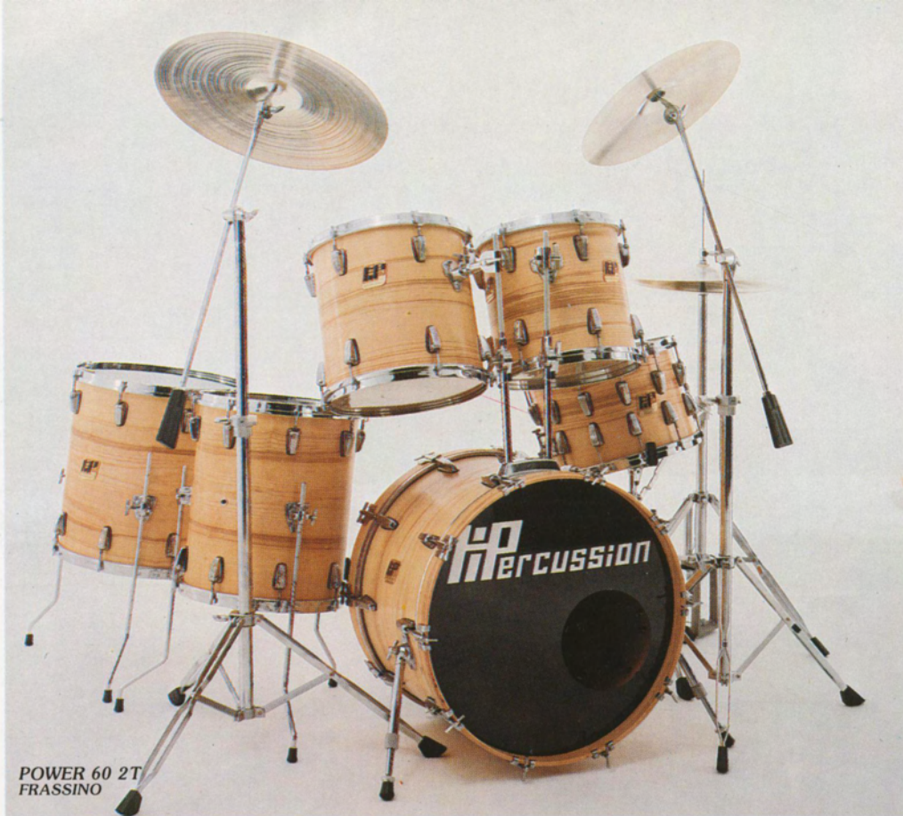
POWER 60 2T FRASSINO