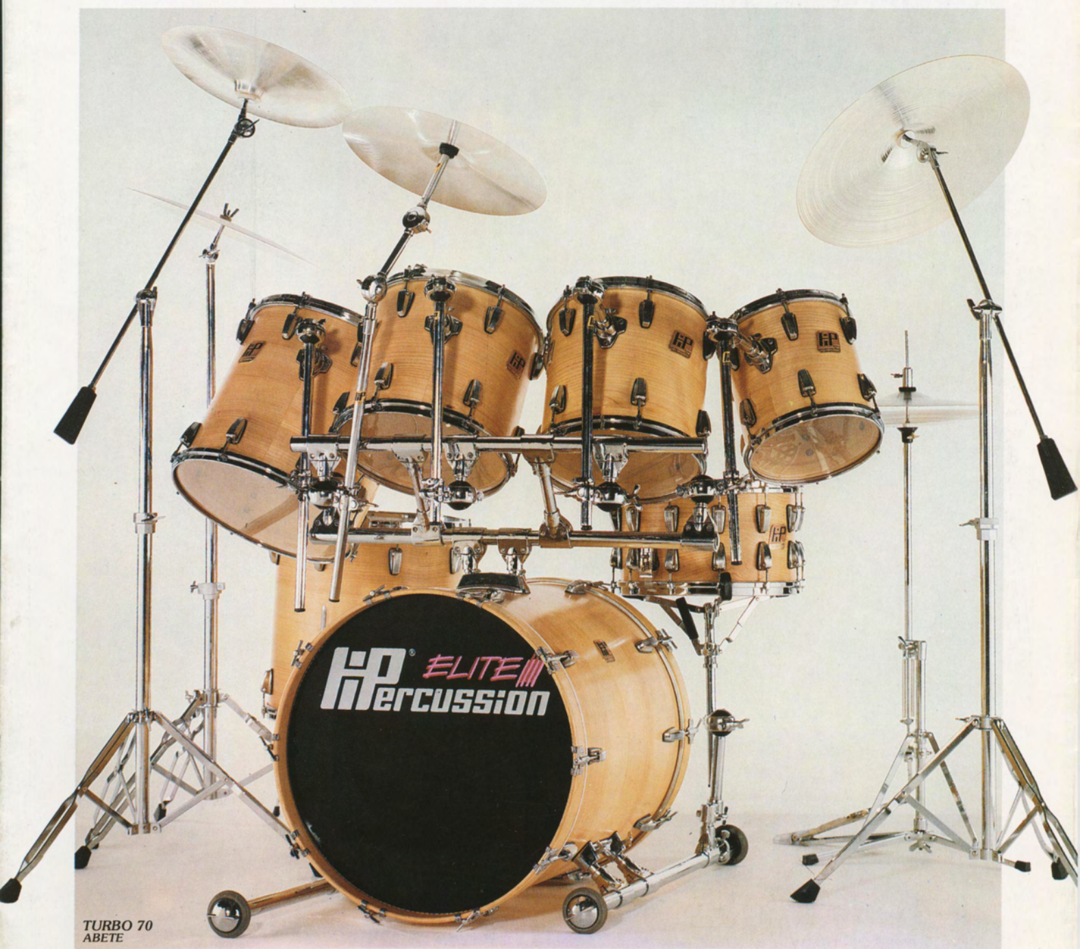
TURBO 70 ABETE

Vengono completate con speciali custodie imbottite costruite in materiale impermeabile, antistrappo, antiurto e di accessori superprofessionali.