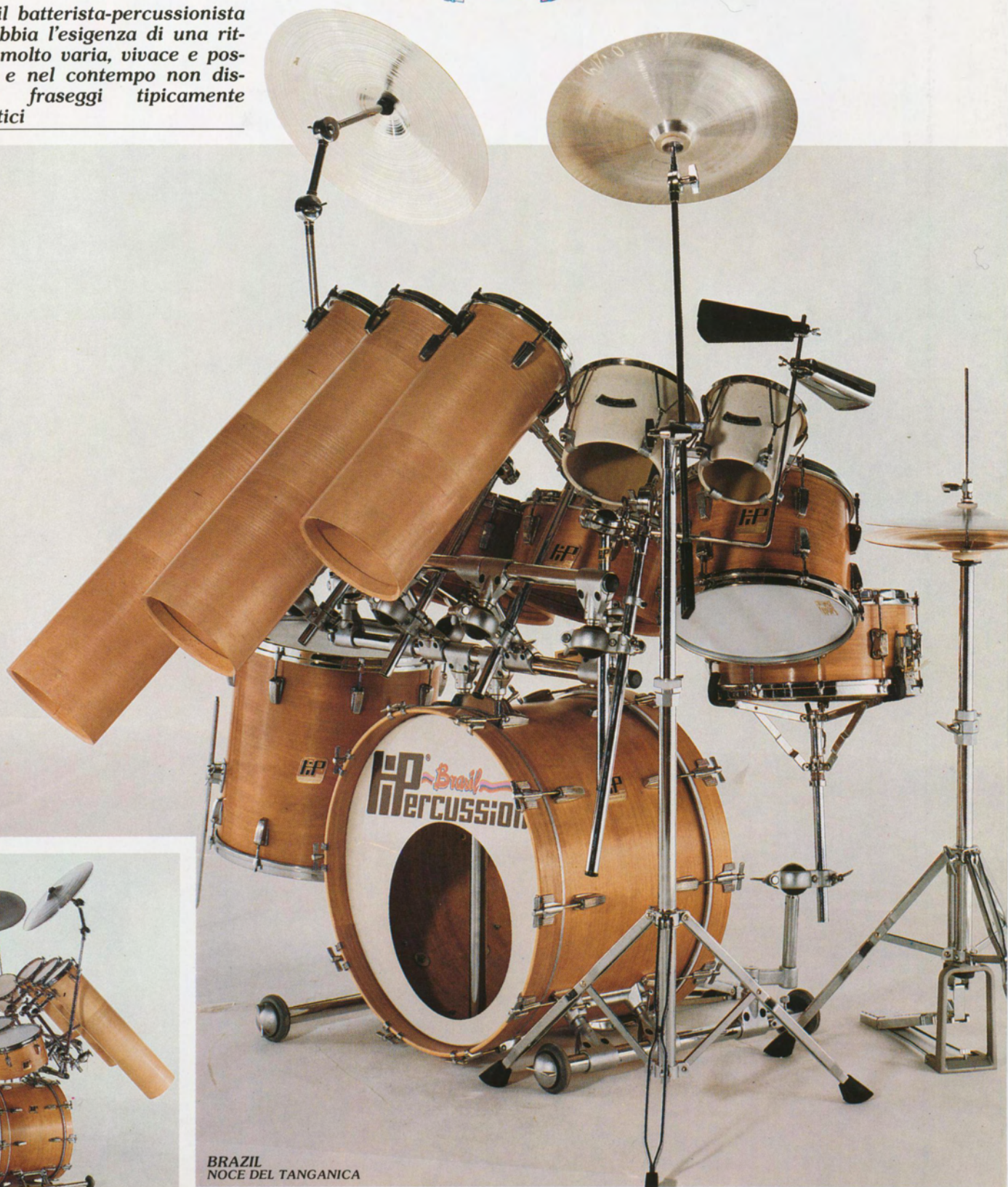
BRAZIL NOCE DEL TANGANICA